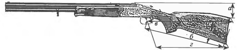
Рис. 2. Размеры приклада

Особое внимание нужно уделить размерам приклада (рис. 2): а — вертикальный погиб у затыльника, б — длина от спускового крючка до середины затыльника ( L ), в — длина от спускового крючка до пятки затыльника (пересекается с вертикальным погибом у затыльника, размер L+5\text{мм} ), г — длина от спускового крючка до носки затыльника ( L+10\text{мм} ). Величины в и г будут определять питч приклада. В статье